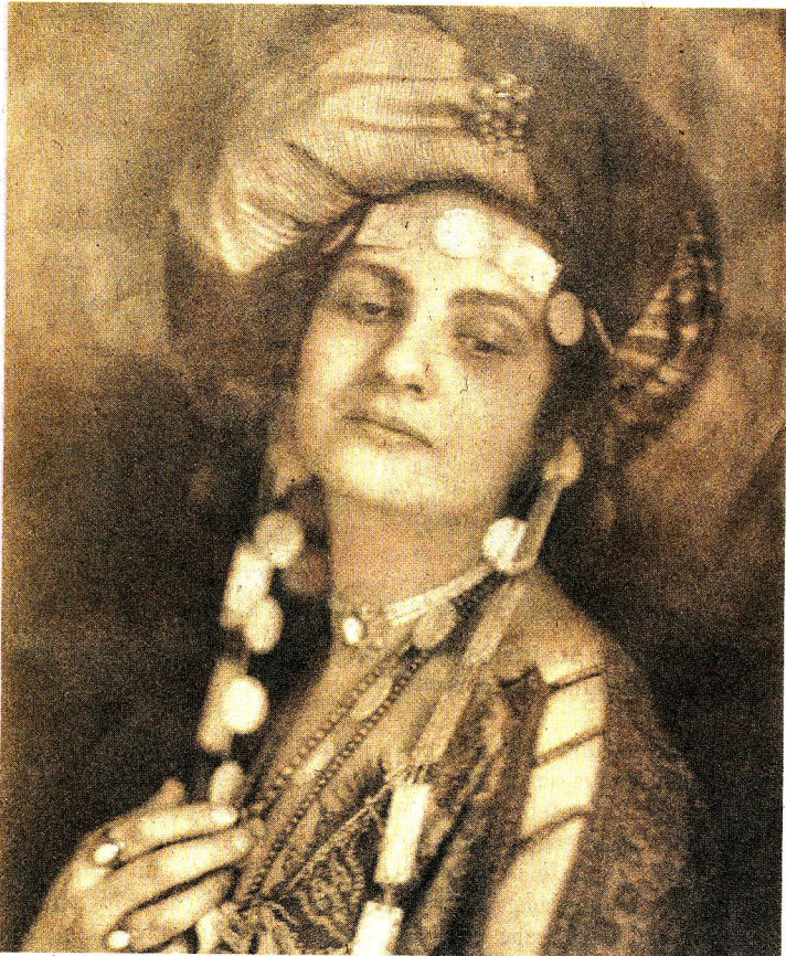
Ein Bildnis von Ida Dehmel, um das Jahr 1910. Sie hat die GEDOK 1926 ins Leben gerufen.

Zum Start ins Jubiläumsjahr laden zwei Ausstellungen sowie ein Konzert, eine Buchpremiere, Poesie, Performance und mehr zum abwechslungsreichen Kunstgenuss ein. 70 Kunstschaffende der GEDOK Hamburg zeigen im Kunstforum, Lange Reihe 75, wie Kunst wachsen kann, selbst wenn die Zeiten rau sind. Die Ausstellung „... da blüht uns was!“ lenkt den Blick auf die zarten, rebellischen und widerstandsfähigen Momente der Kunst. Mit „Künste • Frauen • Netzwerk“ feiert das benachbarte Museum für Kunst und Gewerbe Hamburg (MK&G) das 100-jährige Bestehen des größten deutsch-österreichischen Künstlerinnenverbands. 15 ausgewählte künstlerische Positionen aller deutschen GEDOK-Regionalgruppen stehen für die Vielfalt von Ausdrucksformen innerhalb der Gemeinschaft – von Malerei über Grafik, Video, Keramik, Textil und Schmuck. Ergänzt wird die Gruppenausstellung durch einen Film über die Kunstmäzenin und Frauenrechtlerin Ida Dehmel (1870–1942), die 1926 die GEDOK in Hamburg als „Gemeinschaft Deutscher und Oesterreichi-